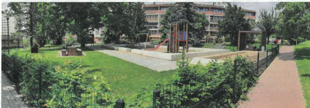
Dnešní relaxační zóna

Městská část Praha 9 zabránila, aby v zástavbě na Střížkově na ploše o výměře více než 0,8 ha vyrostl dvanáctipodlažní „Bytový dům Litvínovská“. Místo toho zde vytvořila park s odpočinkovými zónami a hřišti.